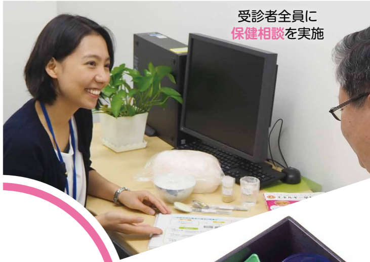
受診者全員に 保健相談を実施