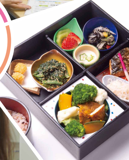
管理栄養士考案の お弁当ランチをご提供