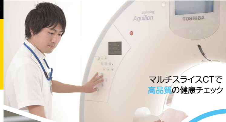
マルチスライスCTで 高品質の健康チェック