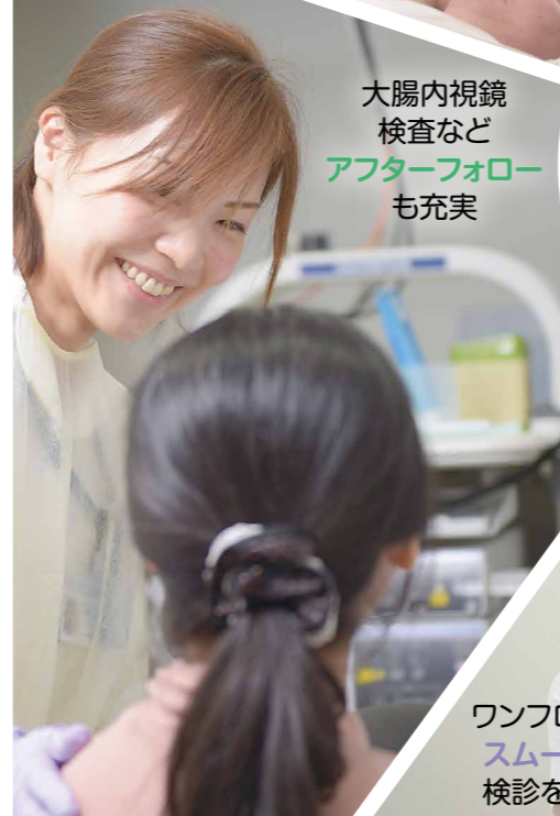
大腸内視鏡 検査など アフターフォロー も充実